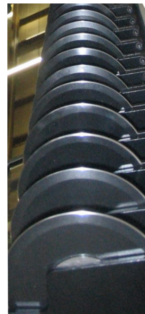
Abbildung einer ähnlichen, bereits ausgelieferten Anlage

Vorteile: - schneller Formatwechsel - geringe Maschinenstillstandzeiten - minimale Rüstzeiten und Kosten